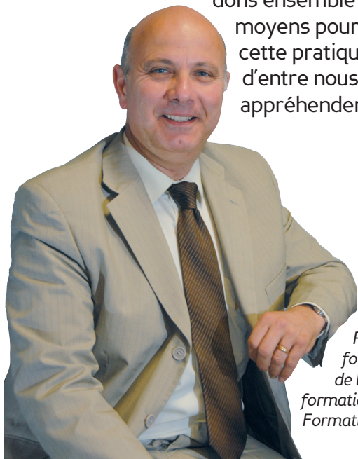
Par Joël Licciardi, formateur, responsable de l'organisme de formation Joël Licciardi Formation (Marseille)

Les occasions de parler en public sont nombreuses, qu'il s'agisse de vie professionnelle, personnelle, familiale, sociale, politique... Regardons ensemble quels sont les moyens pour nous faciliter cette pratique que beaucoup d'entre nous appréhendent.